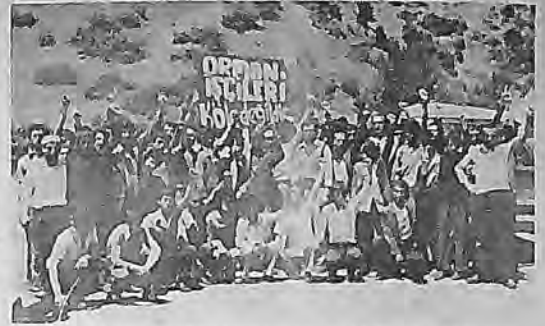
"Orman Haşere ile Mücadele" işçilerinin 15 Haziran 1978 günü başlayan direnişi.

Şavşat lisesinde öğrenci temsilcileri seçimi sırasında Devrimci Yol siyaseti bir forumla kitleye sunuldu. Devrimci öğrenci-öğretmen-halk ilişkileri üzerinde duruldu. Okul temsilcileri direniş komitelerinin denetiminde gerçekleştirilen çalışmalar yapıldı. 16 Mart katliamı için 20 Mart'ta "Faşizme İhtar Eylemi" desteklendi. Bir arkadaş bu konuda okul bahçesinde konuşma yaptıktan sonra yürüyüşe geçildi. Hükümet konağının önünde halkla bütünleşerek yapılan konuşmalarından sonra dağındı. O gün öğrenciler derslere girmediler.