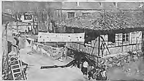
Rize- Çay taban fiyatı ilanı öncesi çalışmalar, Mart 1978

Doğu Karadeniz'de devrimciler çay kampanyası sırasında çok yönlü bir çalışma ile egemen sınıfların baskı ve sömürsünü teşhir ettiler, çay üreticilerinin ekonomik-demokratik taleplerini savundular. Kampanya sırasında faşizmin terör ve demagojisi anlatıldı, faşizme karşı direniş ruhu yükseltildi. Devrimci Yol'un Çay Özel sayısı ve bölge sorunlarına değinen çok sayıda bildiri dağıtıldı. Ayrıca miting, seminerler, toplantılar, afişleme, vb. çalışmalar sürdürüldü. Kampanyanın sona ermesinden sonra çalışmalar gözden geçirildi ve eksiklikler değerlendirilip önümüzdeki günlerde çalışmaların daha verimli sürdürülmesinin şartları tartışıldı.