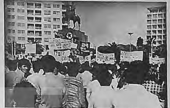
İzmir -Fırın İşçileri Mitingi, 11 Haziran 1978