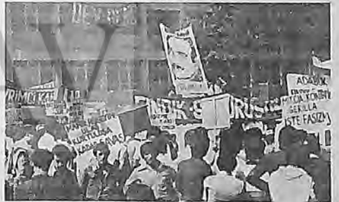
Espiye-Fındık Mitingi, 14 Temmuz 1978

Devrimci Yol taraftarları fındık sömürüsüyle ilgili olarak Giresun'un Espiye ve Ordu'nun Fatsa ilçelerinde "Fındık Sömürüsüne Son" mitingleri düzenlendi.