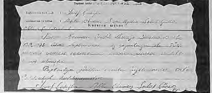
Samsun'daki Dev-Genç yönetiminin DEV-GENÇ'i destekleme kararı.

Dergisi'nde adı yazılmıştı. Daha sonra öğrendiğimiz göre demek başkanının istifası geri alındığı ve daha önce Elazığ Dev-Genç'le ilgili olarak verilen haberin doğru olmadığı anlaşıldı. Bunu düzeltiyoruz.